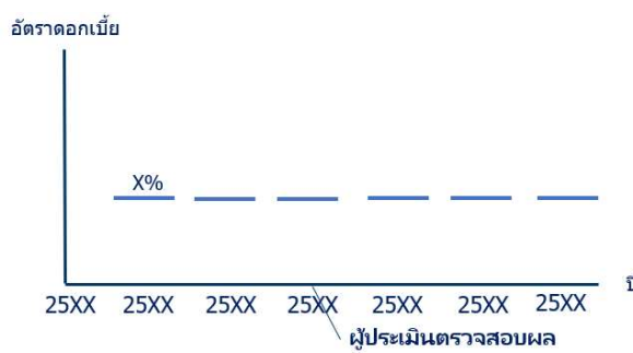
1. กรณีที่ผู้ออกสามารถบรรลุตัวชี้วัดและเป้าหมายด้านความยั่งยืน